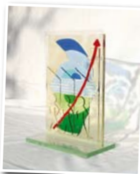
Le trophée réalisé par C. Gorza

La présentation et la compréhension du dossier, la conception, l'innovation et la cohérence, l'acceptation et la participation des travailleurs, les résultats immédiats à espérer, l'efficacité et le budget alloué, la pérennisation des projets, l'intérêt pour la santé publique, le respect de la législation santé et sécurité et droit du travail, l'esprit d'entreprise et la responsabilité sociétale.