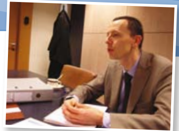
Chez DEXIA BIL