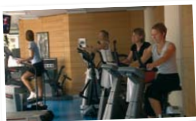
La salle de fitness

Le restaurant de la Banque sert des menus équilibrés et propose des conseils diététiques; des espaces accueillants avec kitchenettes sont mis à disposition des employés pour les pauses café. La vaccination antigrippale et un bilan médical tous les trois ans sont proposés gratuitement à tout le personnel, en collaboration avec l'ASTF (Association pour la Santé au Travail du secteur Financier). Une aide concrète et un accompagnement individuel sont proposés aux employés qui souhaitent arrêter de fumer.