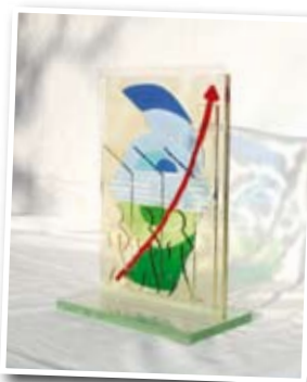
Le trophée réalisé par C. Gorza

La présentation et la compréhension du dossier, la conception, l'innovation et la cohérence, l'acceptation et la participation des travailleurs, les résultats immédiats à espérer, l'efficacité et le budget alloué, la pérennisation des projets, l'intérêt pour la santé publique, le respect de la législation santé et sécurité et droit du travail, l'esprit d'entreprise et la responsabilité sociétale.