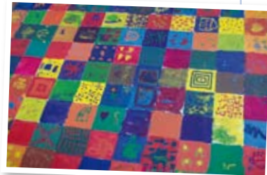
Le tableau réalisé par des enfants de collaborateurs de la Banque de Luxembourg